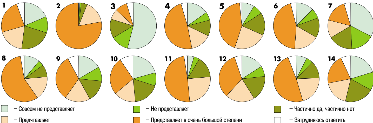
По данным исследования "Современное российское общество, переходный период", проведенного центром "Социоэкспресс" Института социологии РАН с 01.11.1998 по 31.12.1998

Именно иерархия проблем, осознаваемых массовым сознанием как острые, определяет ожидания в отношении политики правительства - его первоочередной задачей видят круг вопросов, связанных с решением материальных проблем.